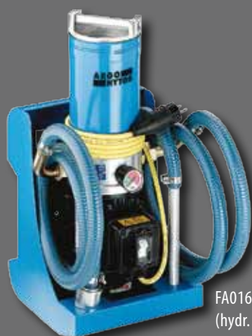
FA016 (hydr. Ölpflege)